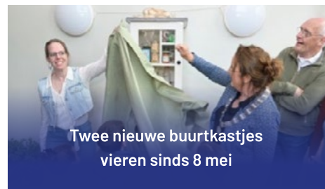
Twee nieuwe buurtkastjes vieren sinds 8 mei

"Het is belangrijk om phisingberichten bij de politie te melden. De bewoners waren blij en tevreden met alle informatie."